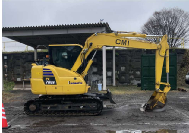
写真-1 油圧ショベルの駐機姿勢

※ ブレードは評価対象でないため、ブレード付きの機械はブレードを上げた状態にして操作しないこと。