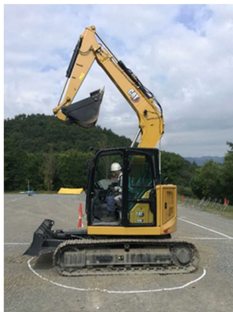
写真-3 油圧ショベルの旋回姿勢

(1) 2 回目の排土後、機械を旋回姿勢にすること。旋回姿勢は、バケット、アームを折りたたみ、ブームを上げて旋回半径を小さくした姿勢で、添付写真のとおりとなっている。