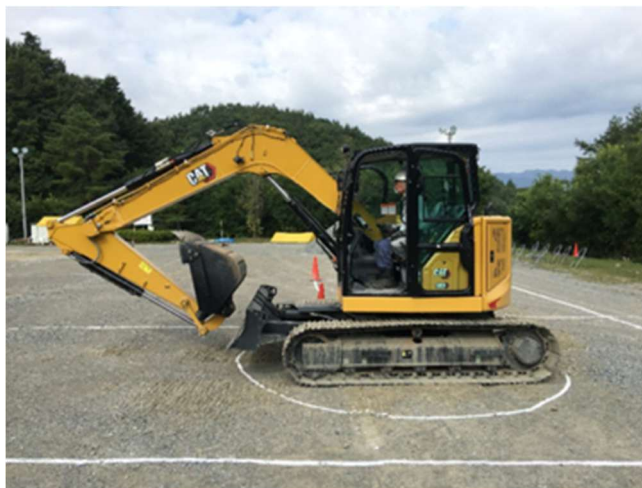
写真-2 油圧ショベルの走行姿勢

アーム、バケットをブーム下側に折りたたんだ状態で、バケットを地面から 40cm 程度上げた走行姿勢にし、エンジン回転速度を上げること。 走行姿勢は添付写真のとおりとなっている。