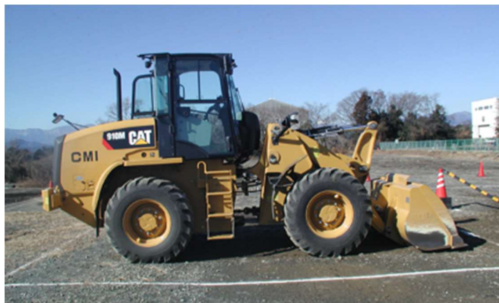
写真-1 ホイールローダの駐機姿勢