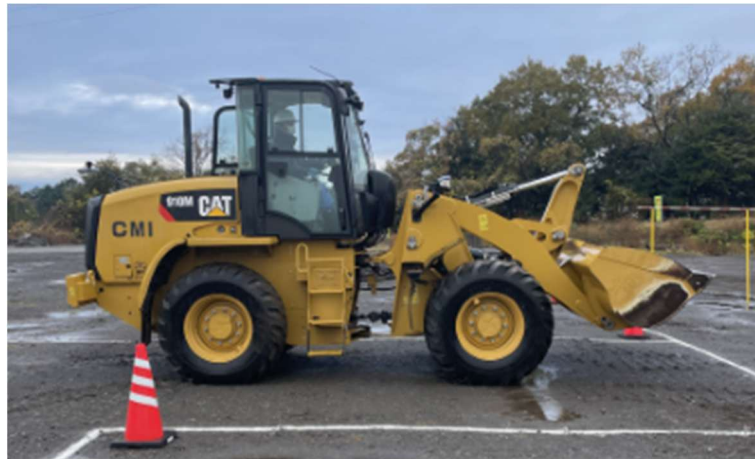
写真-2 ホイールローダの走行姿勢

バケットを最後傾し 40cm 程度地面から上げた走行姿勢にすること。 走行姿勢は添付写真のとおりとなっている。